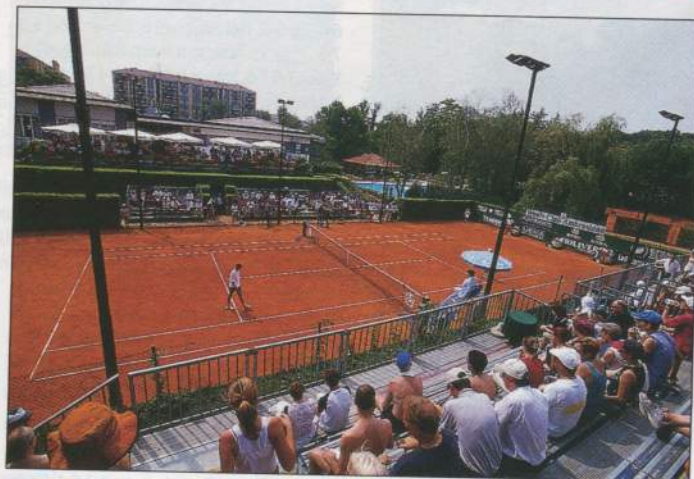
Il centrale del Tc Ambrosiano che ha ospitato la 39ª edizione del torneo