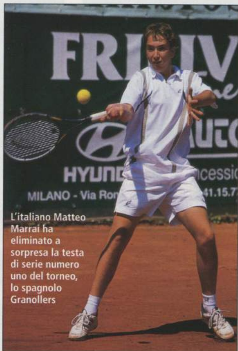
L'italiano Matteo Marrai ha eliminato a sorpresa la testa di serie numero uno del torneo, lo spagnolo Granollers

L'Avvenire, nonostante la concomitanza con i mondiali di calcio, ha chiuso con un bilancio positivo sotto tutti gli aspetti: tecnico, spettacolare e organizzativo. I dirigenti del TC Ambrosiano possono andare fieri della loro creatura che continua a riscuotere un notevole successo di partecipazione e di pubblico. Segno inequivocabile di una leadership a livello internazionale che viene ribadita con i fatti anno dopo anno. La presenza stessa del presidente dell'ITF ing. Francesco Ricci Bitti alle premiazioni ne è eloquente testimonianza.